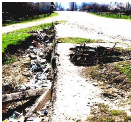
Киркарин хуьруьн рекъин кьерех