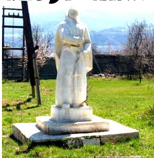
Муьгъверганрин хуьре авай обелиск