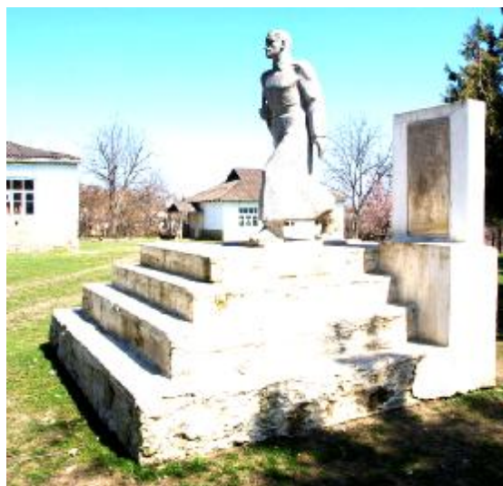
Хуьрелрин хуьруьн обелиск