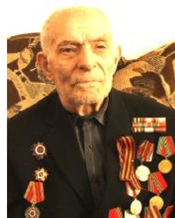
МАГЪАМЕДРАСУЛОВ Магъамедт'агъбир Хъартаскъазмаяр.

РАЙОНДИ - ФРОНТДИЗ МАГЪАРАМДХУЪРЯЙ фронтдиз 2500-далай гзаф итимар фена. Абурукай 1800 касдилай гзаф Ватандин Чехи дяведин ягъунрин майданра игитар хъиз телеф хъана. Хуърера дяведин ялав галукъ тавур хизан саки амукънач. Зегъметдин фронтдани вири хуърерай гзаф инсанри иштиракна. Чи райондин агъалийри танкарин «Дагъустандин колхозчи» колонна туюкълурун патални пул киватуна активвилелди иштиракна.