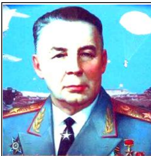
Василий Филиппович МАРГЕЛОВ. армиядин генерал. ВДВ-дин кьушунрин диб эцигай кас. Сад лагъай десантник.

Цавун десантдин сад лагъай подразделение 1931 - йисуз Ленинграддин воен-