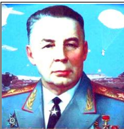
Василий Филиппович МАРГЕЛОВ. армиядин генерал. ВДВ-дин кьушунрин диб эцигай кас. Сад лагъай десантник.

Цавун десантдин сад лагъай подразделение 1931 - йисуз Ленинграддин воен-