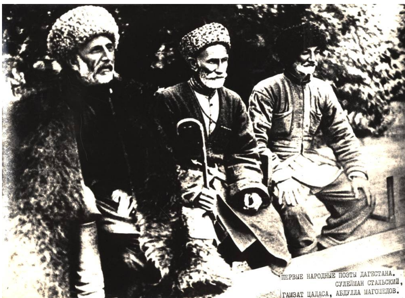
ПЕРВЫЕ НАРОДНЫЕ ПОЭТЫ ДАГЕСТАНА. СУЛЕЙМАН СТАЛЬСКИЙ, ГАМЗАТ ЦАЛАСА, АБДУЛЛА МАГОМЕДОВ.

Программа съезда разрасталась. Ораторам не предвиделось конца, и их речи переносились с утра на вечер, с заседания на заседание. А мы как в лихорадке носились из президиума в почтовое бюро и помещение для машинисток, к мандатному столу или в фойе, куда нас вызывали записками, садились, вставали, совещались, звонком призывали к порядку. А он сидел - как сел в первый день в барашковой